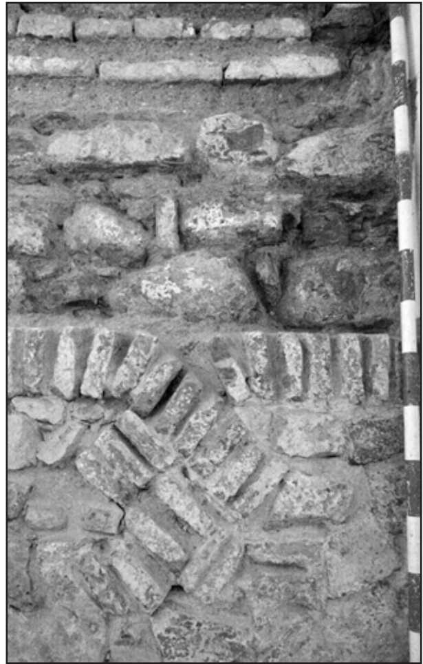
Imagen 4. Proceso II. Detalle de lacería de ladrillo y pretil original de la nave meridional.

tizones, que se puede apreciar en casi todo el perímetro exterior. Esta fábrica ha aparecido, en toda su extensión, en la planta baja del lienzo septentrional del pabellón norte (imagen 1) y del lienzo meridional del pabellón sur. Son también de esta época las puertas oriental y occidental del Castillo y el pequeño postigo abierto en la muralla septentrional que se podía ver desde el patio oriental y cuya continuación se ha documentado en el pabellón norte. Con respecto a la puerta occidental el trabajo ha puesto a descubierto la fábrica original de la bóveda de entrada a base de dovelas pétreas, y confirma la cronología de los puestos de guardia relacionados con esta