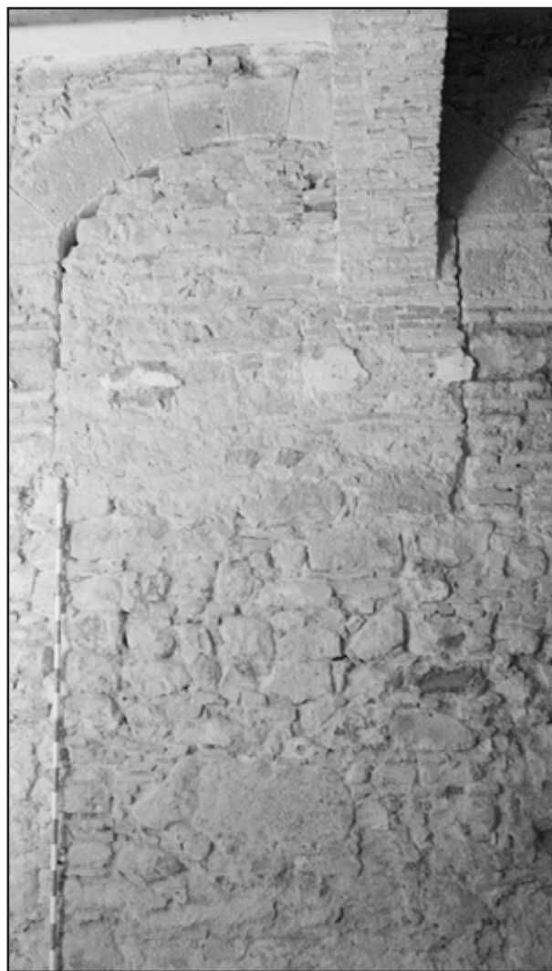
Imagen 2. Proceso II. Puerta monumental en planta baja del pabellón meridional

Tras la reconquista de Sancho IV en 1292 y diversas contingencias medievales, el castillo se convirtió en sede del nuevo poder señorial, a modo de ciudadela de la villa fronteriza, iniciándose un proceso de adecuación de su espacio interior a sus nuevas necesidades. A la primera fase de su transformación residencial siguió otra con la adición de una serie de pabellones que permitiesen su uso cuartelero mantenido hasta fechas recientes.