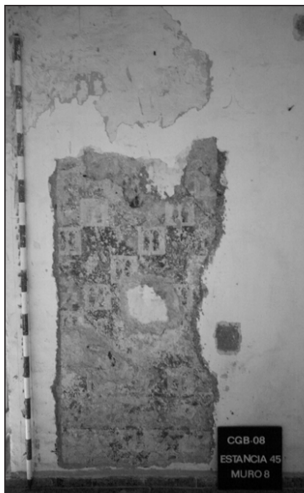
Imagen 6. Nuevo paño decorado con pintura mural en la zona oriental de la sala de armas

Nos encontramos ante una fortaleza suficientemente bien conservada de origen califal y un conjunto de pabellones de época cristiana, anexionados interiormente a los muros del recinto amurallado. De estos pabellones hay algunos que han desaparecido, si bien es posible reconocer los restos de su cimentación, y por tanto, su implantación y, otros que aún conservándose en lo esencial, han sufrido adulteraciones de más o menos calado a lo largo de la historia. A esto, hay que añadir el potencial arqueológico subyacente, especialmente en ambos patios. Todo ello nos hace pensar, que estamos ante una pieza de la arquitectura defensiva y también palaciega de gran porte, y sobre todo con un potencial importante, si se actúa sobre la misma con los objetivos de lograr su conservación-consolidación, restauración y puesta en valor, además de darle un uso coherente y actual en relación contenedor-contenido, así como la musealización de todo el conjunto, que permita el disfrute y la comprensión del mismo: su carga cul-