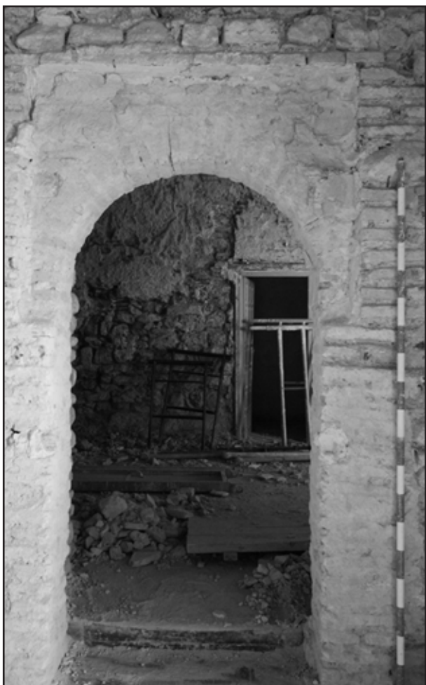
Imagen 5. Proceso III. Puerta con alfiz en planta primera de nave septentrional

Fecha a inicios del siglo XVI y que se puede atribuir a Don Fadrique Enríquez, el primer marqués de Tarifa, que como indica un manuscrito anónimo, realizó obras de acondicionamiento en el Castillo 6 .