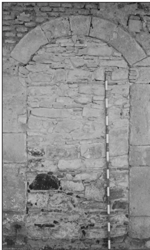
Imagen 3. Proceso II. Puerta situada en la galería, en planta primera.

e).- Muestreos edilicios, para lo que se está