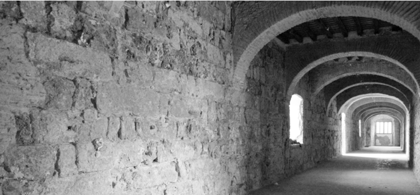
Imagen 1. Proceso I. Aparejo califal en planta baja del pabellón meridional